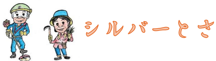
センターマスコットキャラクター「メメ&ペペ」 by K.Sakamoto