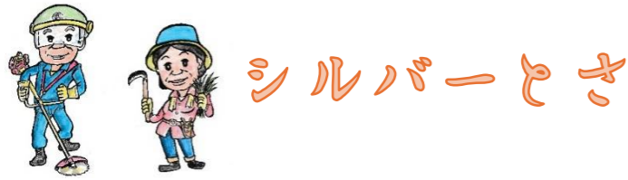
センターマスコットキャラクター「メメ&ベベ」 by K.Sakamoto