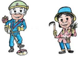
センターマスコットキャラクター「メメ&ベベ」 by K. Sakamoto